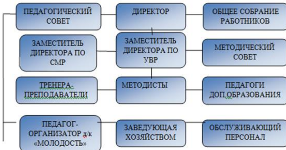
Рисунок 1 – Структура МОУДО ДЮЦ «Азимут»

Сложившаяся система управления МОУДО ДЮЦ «Азимут» обеспечивает выполнение поставленных целей и задач и в целом соответствует современным требованиям. Структура управления деятельности Центра представлена на Рисунке 1.